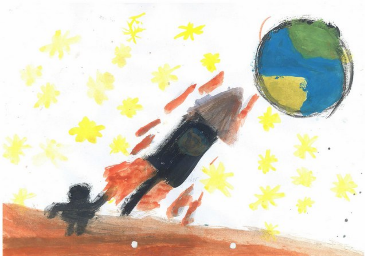
Zeichnung eines Schülers der Christlichen Schule Dresden-Zschachwitz

Es soll nicht unerwähnt bleiben, dass die Zauberfee mit ganz viel Optimismus am Ende ihr Ziel erreicht!