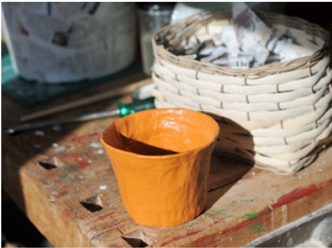
Ein Blumentopf aus Papier. Funktioniert.