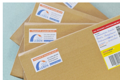
Zum Schluss kommt noch ein Gruß von Gut Leben aufs Paket und ab geht die Post!