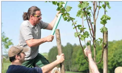
Garten- und Landschaftsgestaltung