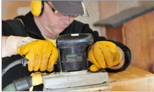
Handwerk | Holzverarbeitung