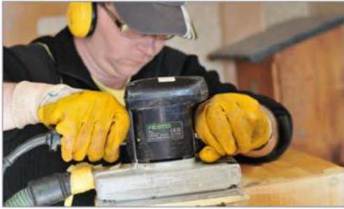
Handwerk | Holzverarbeitung