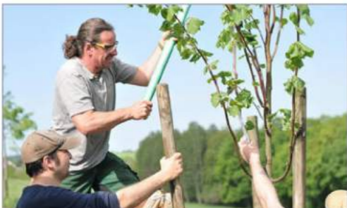
Garten- und Landschaftsgestaltung